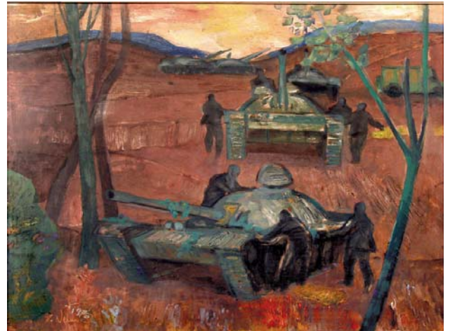
Dezaktivácia 1973, olejová tempera, sololit, 50x63