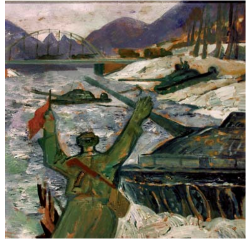
Zimný prechod tankov 1971, olejová tempera, sololit, 63x50