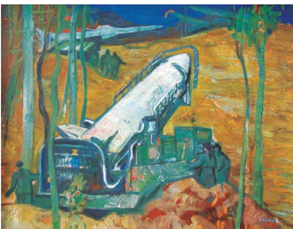
Rakety 1972, olej, sololit, 50x63