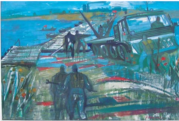
Prekonanie rieky 1974, olej, sololit, 50x69