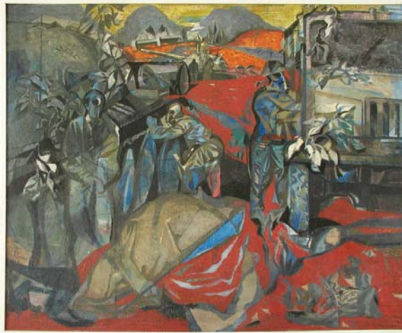
Dezaktivácia 1966, olej, plátno, 125x150