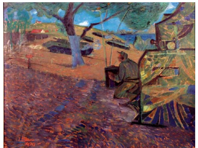
Na cvičení 1970, olejová tempera, sololit, 50x63