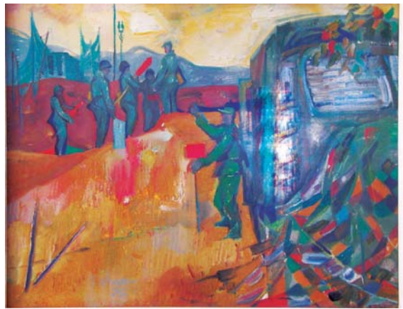
Súčinnosť 1974, olejová tempera, sololit, 97x120