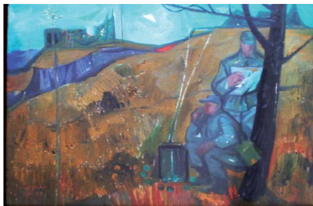
Spojári v teréne 1973, olejová tempera, sololit, 49x70